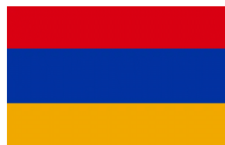
República de Armenia