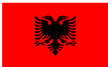
República de Albania

En virtud de esta resolución, se incluyen en el listado, de manera alfabética, las siguientes jurisdicciones: